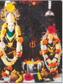
|| माता बारोडहिणी प्रसन्न ||